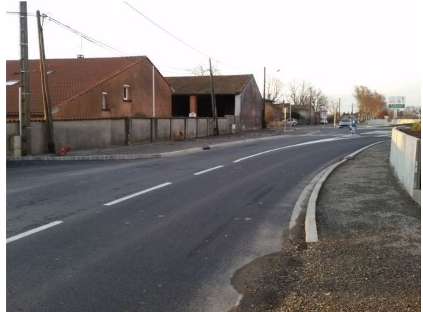
Figure 7: Aux abords du rond-point, rien ne semble prévu pour les vélos