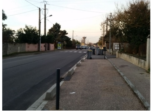
Figure 5: Ici, un parking à conteneurs de poubelles