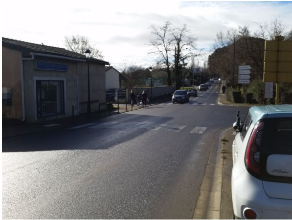
Figure 10: Le tronçon le plus étroit