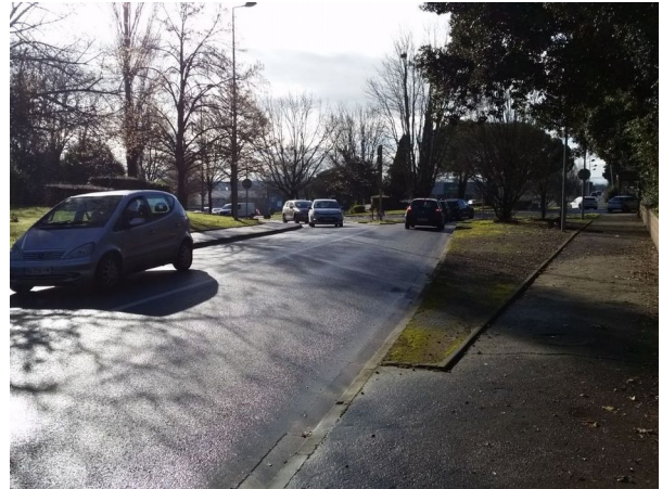
Figure 11: La largeur permet le raccordement à la piste existante (à gauche)