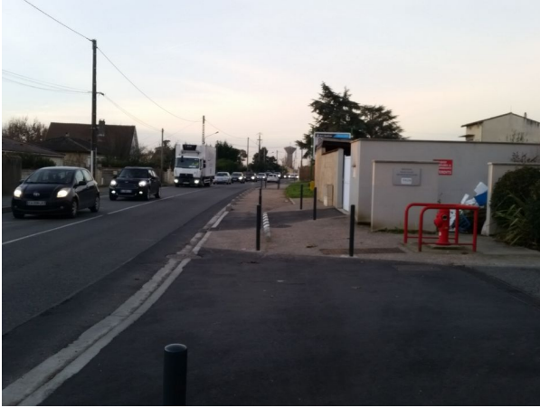
Figure 4: Des potelets, un marquage et des bordures de trottoir incohérents