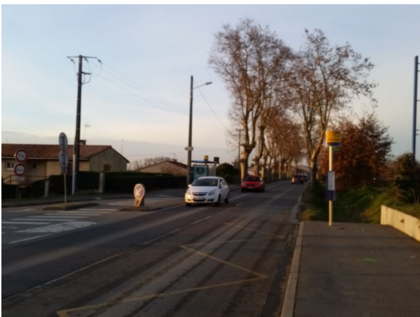
Figure 8: partie à aménager, l'emprise le permet