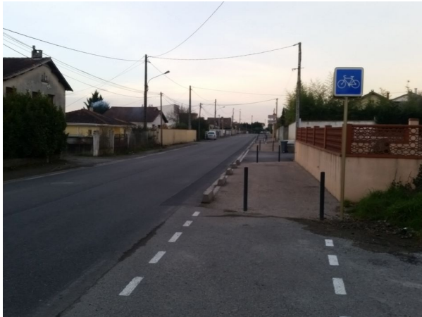
Figure 2: Un marquage sur un trottoir existant et des potelets contre les voitures