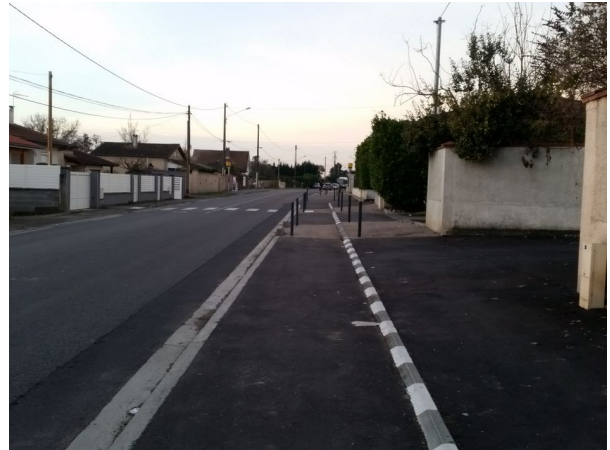
Figure 3: Toujours des potelets qui diminuent l'emprise et une bordure de trottoir en plein milieu