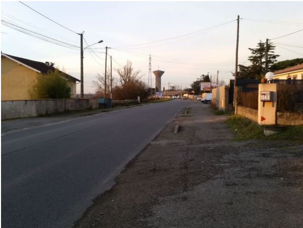
Figure 6: Ici, même plus de marquage, est ce toujours une piste cyclable ?