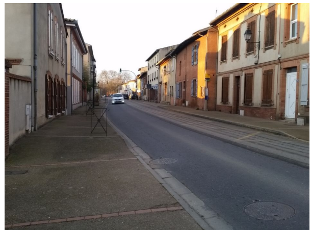
Figure 9: Dans le centre, l'emprise permettrait l'aménagement